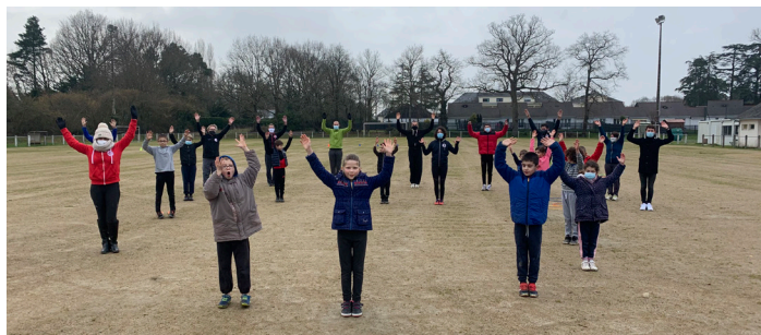
Les entrainements s'effectuent désormais au grand air!