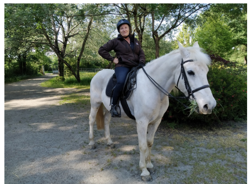
Retour de balade

Téléphone 06.07.52.14.15 et le mail chevalloisirsheric@gmail.com