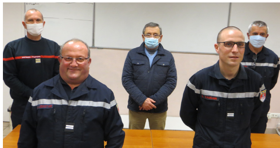
Les Sapeurs-Pompiers héricois promus.

En effet, pour cette première promotion de l'année, trois Sapeurs-pompiers ont été promus au grade supérieur. Compte tenu des contraintes sanitaires, ces remises de galons ont été réalisées en comité restreint dans l'enceinte du CIS, en présence des autorités municipales ainsi que du SDIS 44.